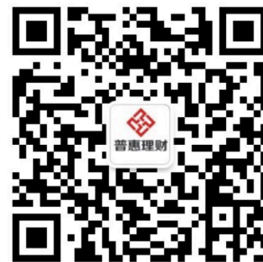
普惠理财微信公众号