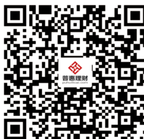
普惠理财手机注册二维码